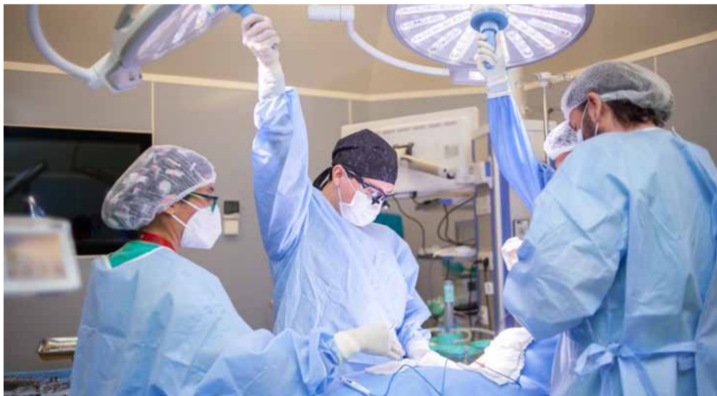
Las cifras dadas a conocer por el director del recinto hospitalario, corresponden al proceso de reactivación post pandemia.

En 2019 el recinto asistencial realizó 11.866 cirugías, por lo tanto, según señaló el doctor Gutiérrez, "con total certeza podemos decirle a la comunidad que estamos cerca de lograr ese volumen de actividad quirúrgica que se alcanzó con 5 pabellones en el antiguo hospital, mientras que aquí en nuestra nueva casa tenemos 7 de estos recintos, por lo tanto, el objetivo de este año como institución es potenciar a nuestros equipos para que podamos resolver los problemas de salud de nuestra población con