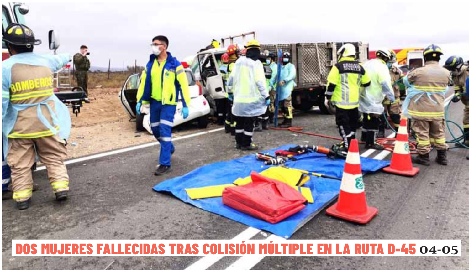
DOS MUJERES FALLECIDAS TRAS COLISIÓN MÚLTIPLE EN LA RUTA D-45 04-05