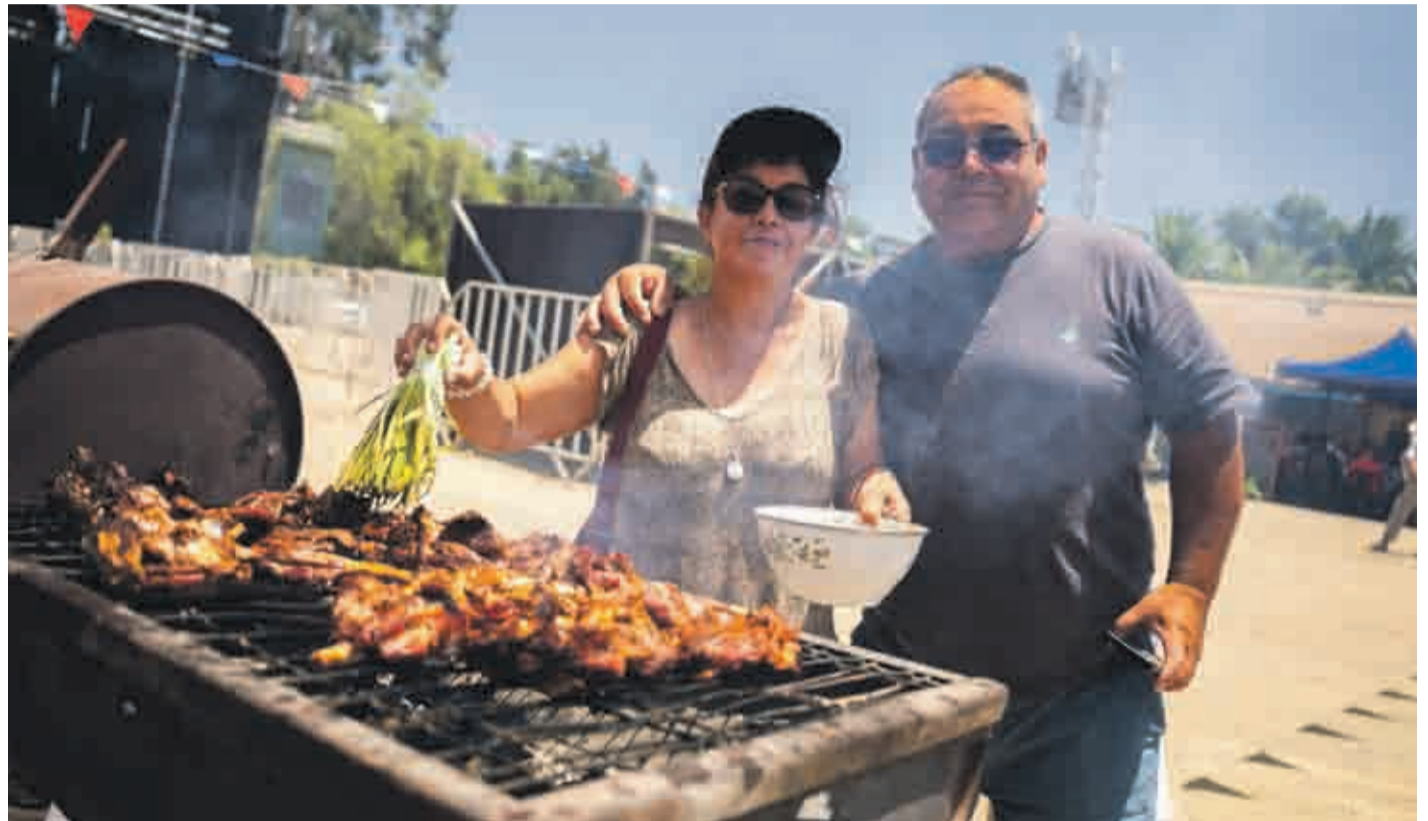
El evento se desarrolló en el Parque Recreacional Los Peñones en la capital provincial.

Durante dos días, la Fiesta del Cabrito y el Queso de Cabra fue un festín para los amantes de la gastronomía típica, con platos destacados que resaltaban la exquisitez de nuestros productos típicos, deleitando los paladares de los asistentes. Las áreas de emprendedores fueron un punto focal, brindando una plataforma para los productores locales y sus productos típicos. Desde artesanías hasta productos lácteos artesana-