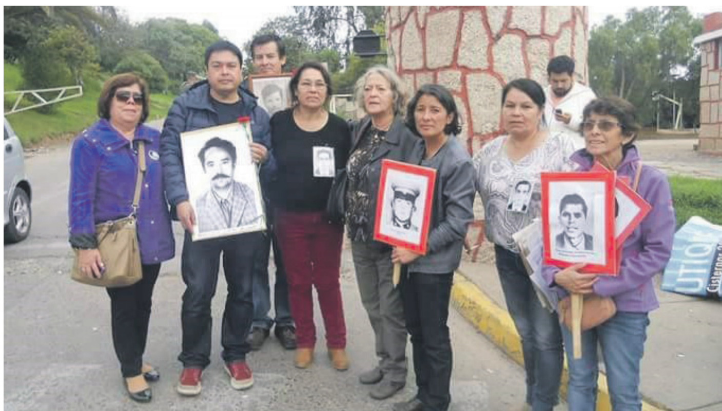
Años de lucha han liderado las familias de los asesinados por la Caravana de la Muerte. Hoy sienten profunda indignación.