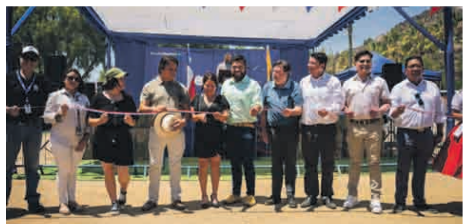
La fiesta destacó por una gran afluencia de público ante la presencia de autoridades.