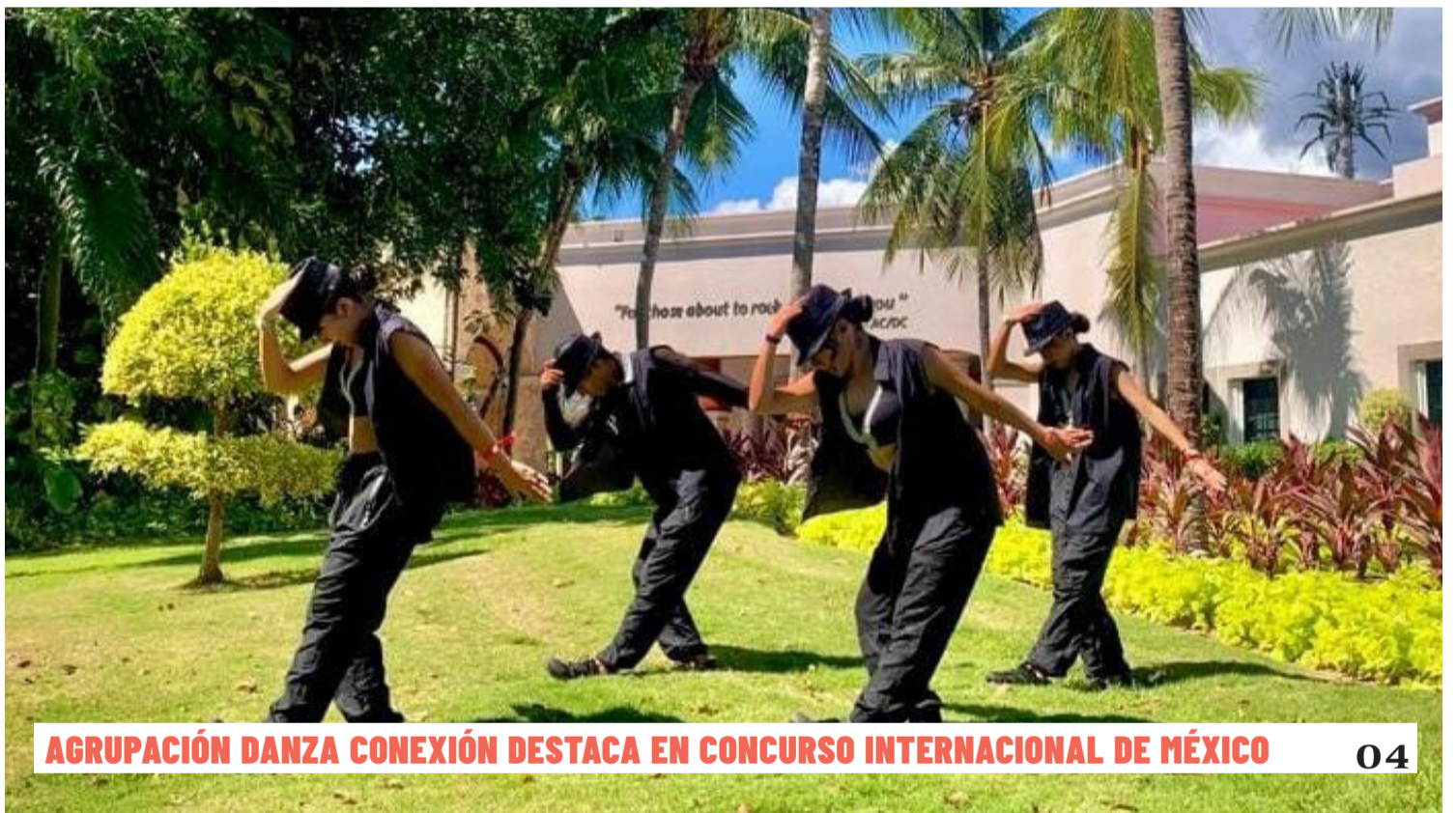
AGRUPACIÓN DANZA CONEXIÓN DESTACA EN CONCURSO INTERNACIONAL DE MÉXICO