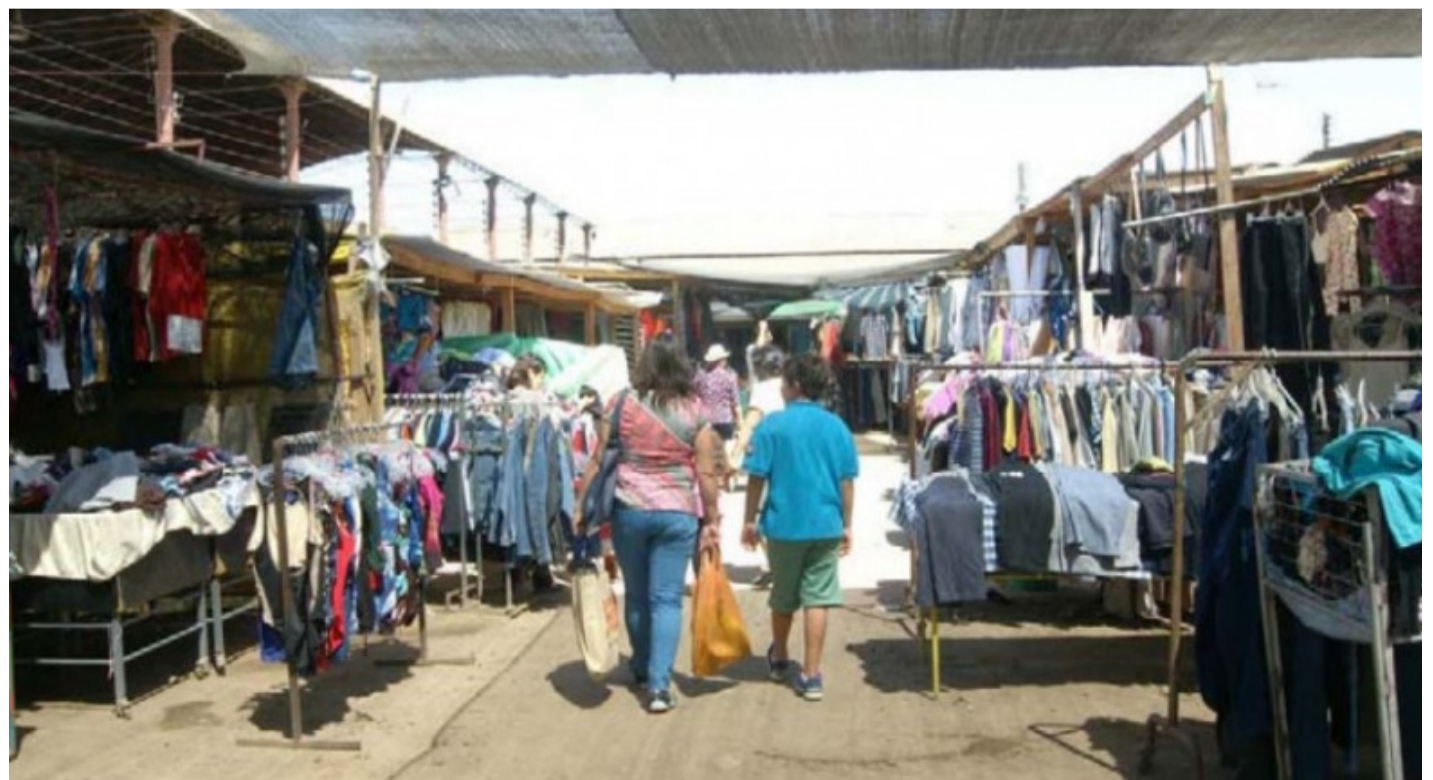
El sector de ropa americana por mucho tiempo ha acusado la falta de mejores espacios para sus ventas.

También se considera una nivelación de la superficie del terreno y un recubrimiento de suelo del tipo maicillo compactado, de modo de evitar el exceso de partículas en suspensión", declaró.