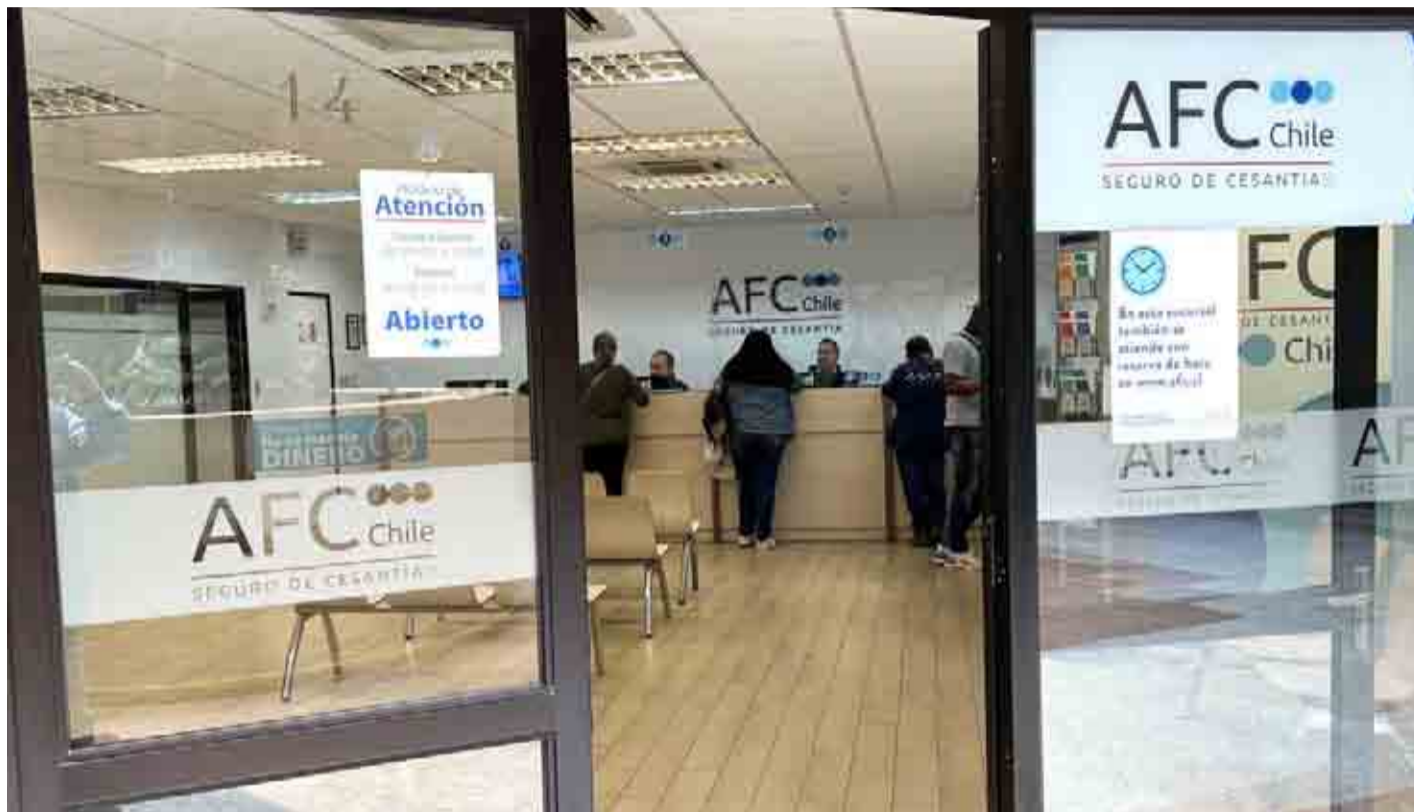
La tasa de desocupación de las provincias de Elqui y Limarí fue de 11,2 y 7,8% respectivamente.

“Nuestra región se encuentra en un proceso de recuperación progresiva en materia económica, además de laboral desde el momento más difícil de la pandemia, sobre todo, en áreas tan sensibles como el agro, afectado de manera permanente por la escasez hídrica y el turismo, que