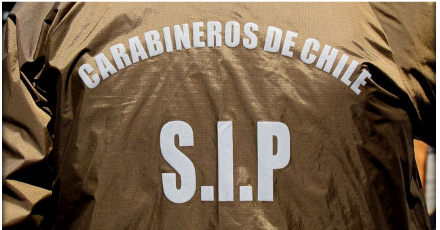
Personal de la SIP de Carabineros detuvo a un sujeto identificado como J. R. R. M., de 70 años de edad.

De esta manera, la Sección de Investigación Policial de Carabineros