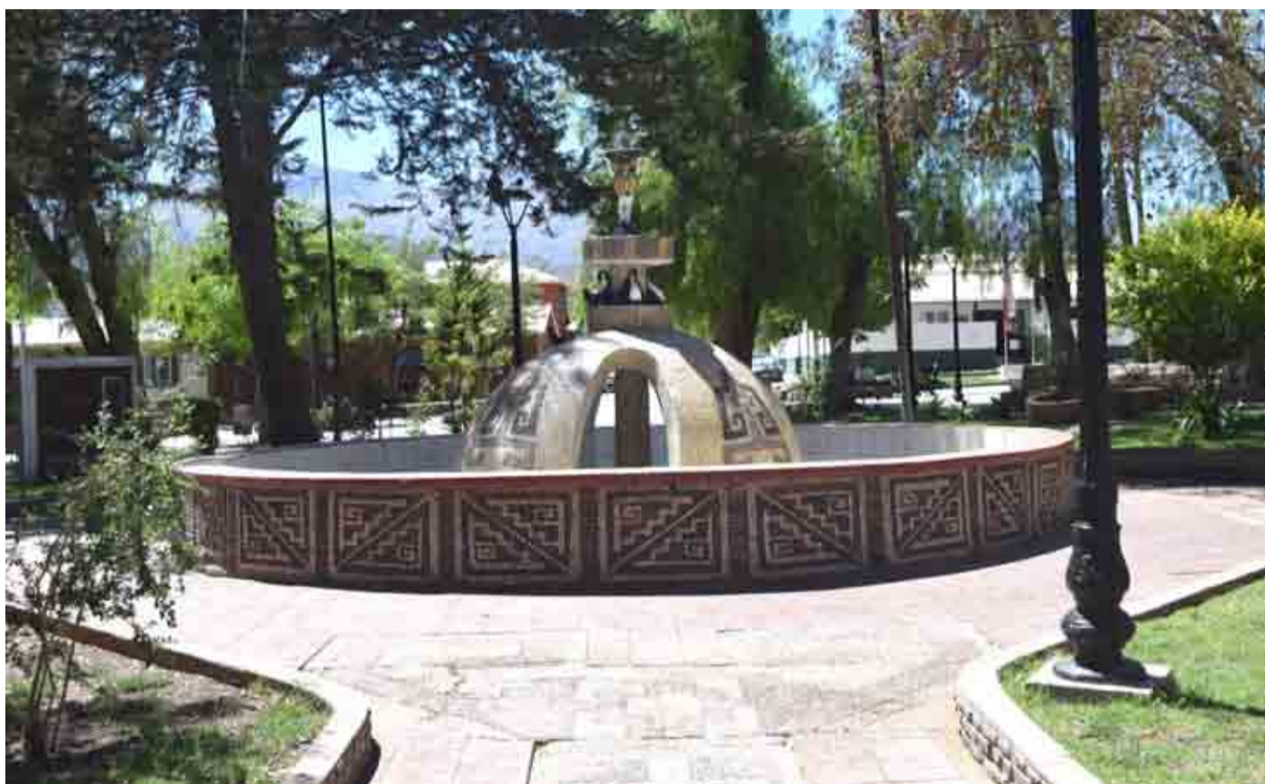
Combarbalá celebra este jueves 30 de noviembre sus 234 años de historia.

“Todavía no se llega con electricidad a muchos pueblos rurales que han quedado abandonados, y a estas alturas de la vida no podemos vivir así. También faltan pavimentos y alcantarillado, tenemos deficiencias