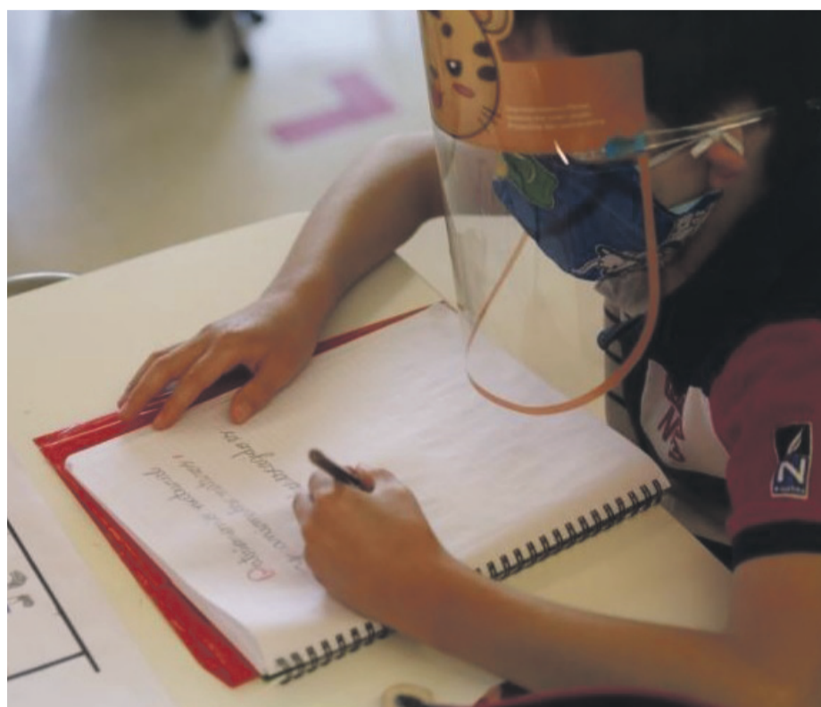
Los establecimientos municipales de Ovalle se encuentran afinando los protocolos.

Mientras apoderados y profesores no se sienten seguros para regresar a las aulas el próximo 02 de marzo, desde el futuro gobierno reconocen que esperan que la presencialidad “sea la regla”. Sin embargo, afirman que están dispuestos a repensar la política en función del contexto sanitario en aquella fecha.