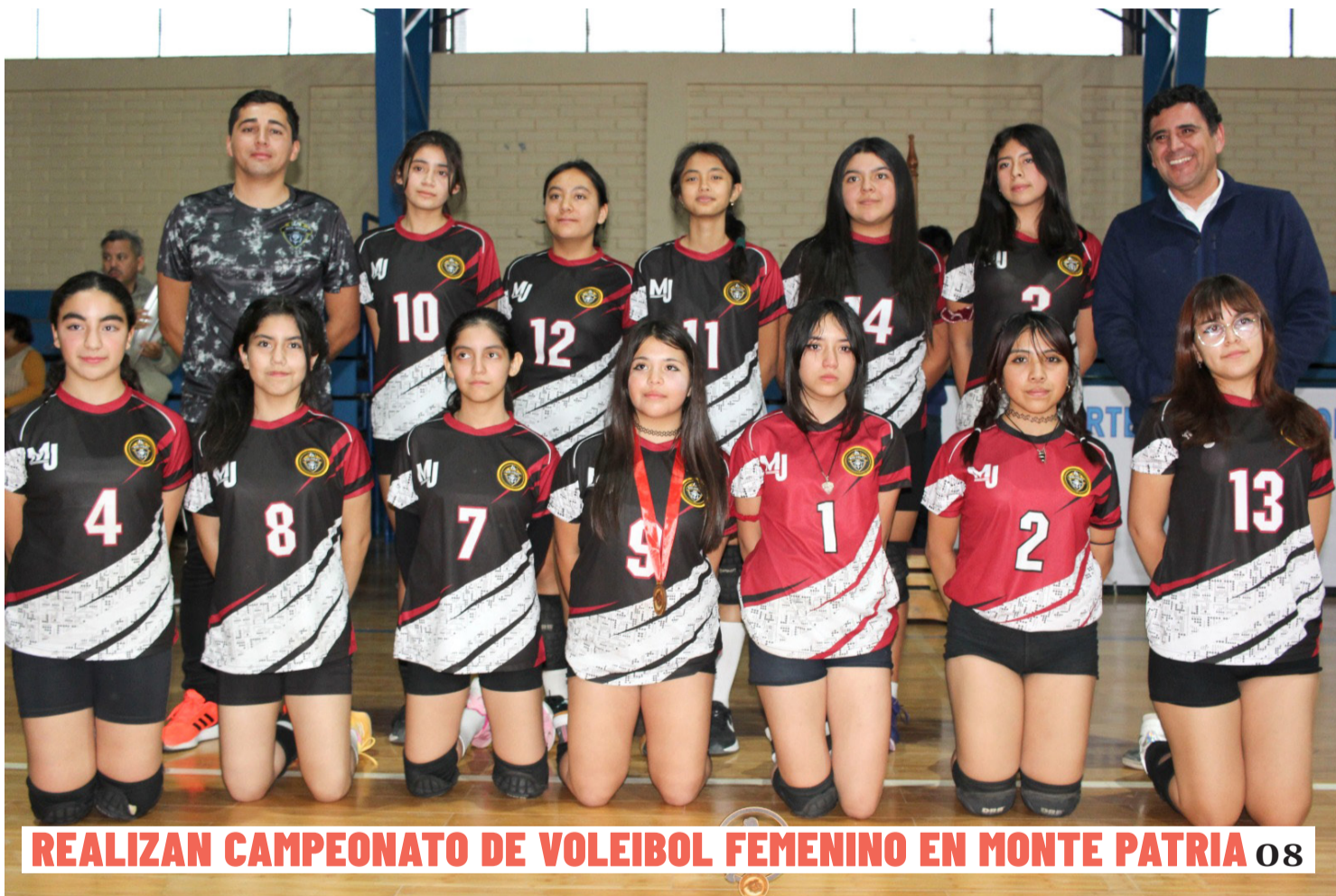
REALIZAN CAMPEONATO DE VOLEIBOL FEMENINO EN MONTE PATRIA 08

EN MEDIO DE UNA BAJA EJECUCIÓN PRESUPUESTARIA