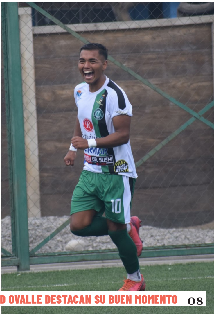
LOS GOLEADORES DE PROVINCIAL OVALLE Y CSD OVALLE DESTACAN SU BUEN MOMENTO 08